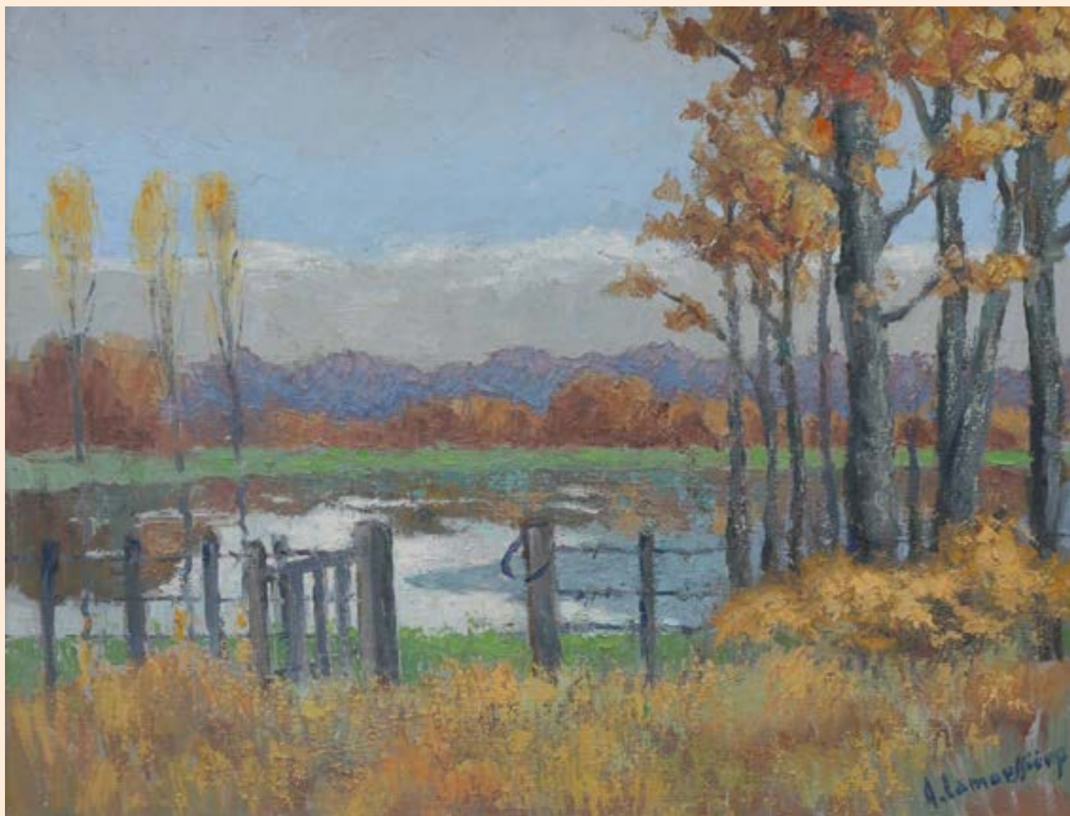
Paysage de A. Lamoussière (Jouet sur l'Aubois)

Dans un tout autre domaine, le dénombrement de la population en 1861 indique le nombre de maisons couvertes de chaume -minorité- ou de tuiles, d'ardoises et de zinc. Ailleurs, les cartes du cadastre napoléonien datant de 1836, également accessibles en ligne, donnent à voir une répartition des terres sans doute éloignées de celle que nous connaissons aujourd'hui même si les rivières et le tracé du canal permettent de se repérer. Grâce aux vues aériennes aujourd'hui disponibles sur la toile, d'autres paysages se dessinent dont on peut discerner les variations. Mais ce sera pour le prochain numéro. Brigitte ROLLET